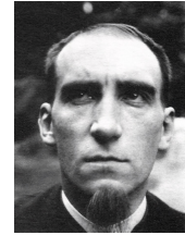
Paul Signac : Félix Fénéon vers 1890 Museum of Modern Art, NY

Personnage atypique et légendaire, Fénéon est décrit comme : anarchiste, employé au Ministère de la Guerre, grammairien, critique d'art, critique littéraire, journaliste, vendeur de tableaux, directeur de revue, puis de maison d'édition, farouchement dreyfusard, signataire du Manifeste des intellectuels publié par L'Aurore (14 janvier 98), défenseur de Seurat du néo-impressionnisme, de la poésie de Mallarmé, collectionneur d'art africain et océanien avant l'heure (450 pièces à sa mort, objets de référence majeure pour les arts premiers), puis de Matisse, Kees Van Dongen et Modigliani, esprit fin et caustique à la plume acerbe et précise, séducteur discret .